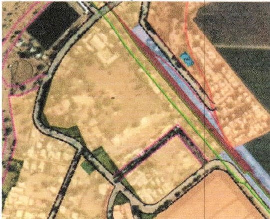
Buffer área verde 20 metros

RESPUESTA: Se propone reducir la propuesta inicial de buffer de área verde de 20 metros a 10 metros en Estación Polpaico, dada la consolidación del sector como se observa en las imágenes.