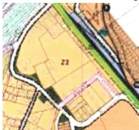
Buffer área verde 10 metros

OBSERVACIÓN: Revisar uso suelo infraestructura de servicio sanitario en zonas mixtas